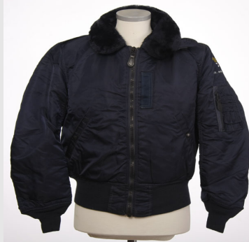
Bomber B-15 Wool